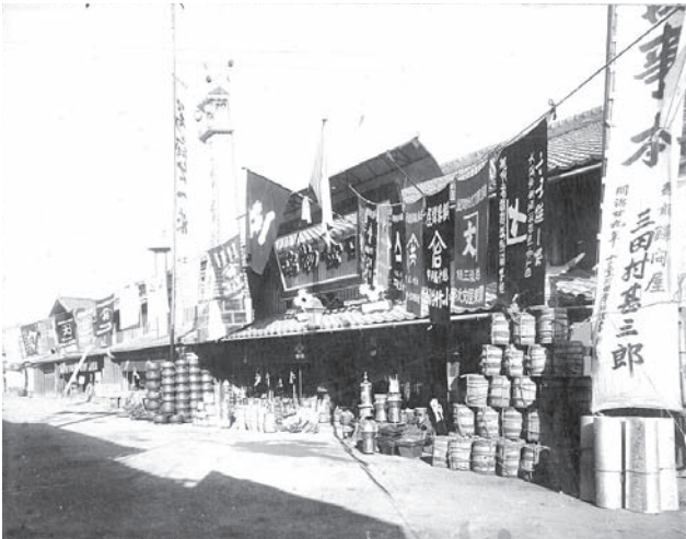
明治28年 関口金物店 開店記念写真