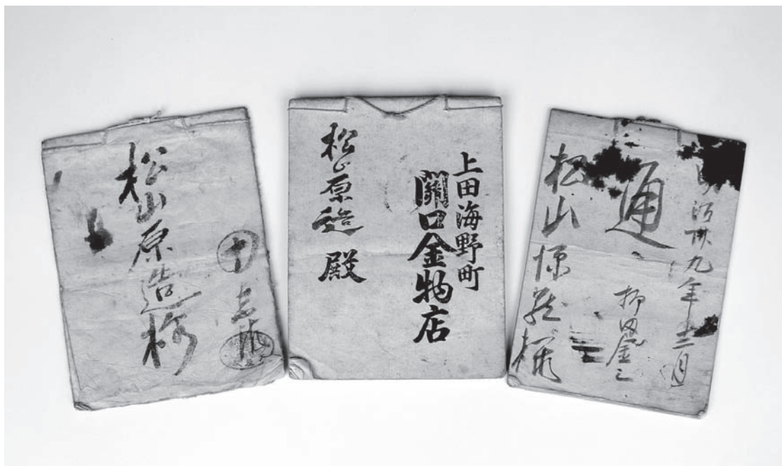
通帳 ①葉鐘屋 関口金物店 柳田金三