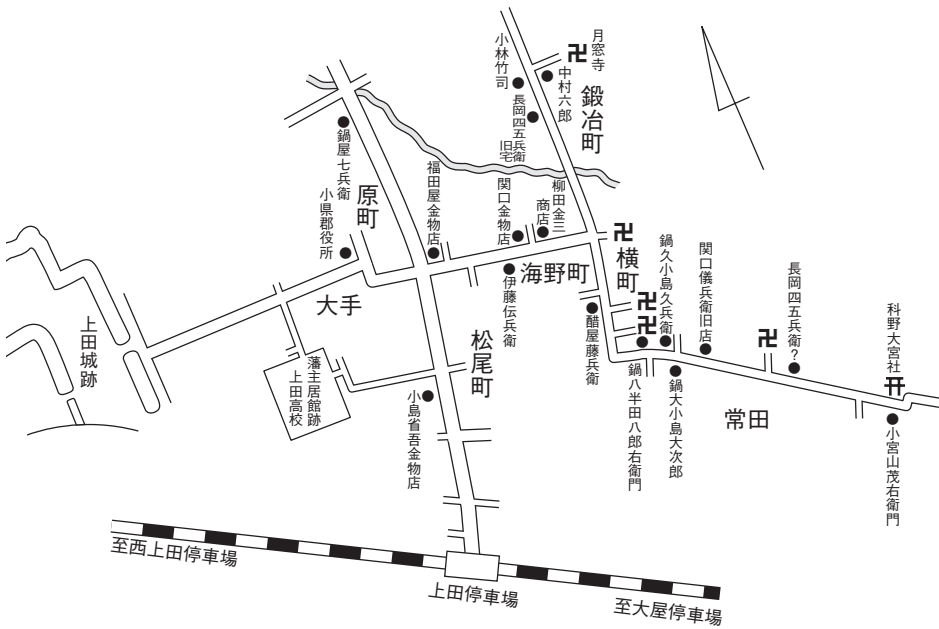
明治30年代 上田の鍛冶・鋳物師・金物商の所在

助彌・安兵衛・善六・忠次郎・文五郎・清七・久兵衛・助藏・与五兵衛・文四郎・源七・千助・彦左衛門・孫七・庄兵衛・甚七・市之丞・甚右衛門・伊助・傳八・久右衛門・源藏・才兵衛・孫藤七・源四郎・權九郎・作兵衛・九郎・彌右衛門・傳助」の名